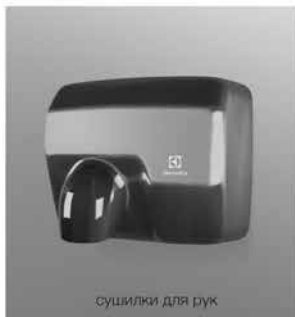
сушилки для рук